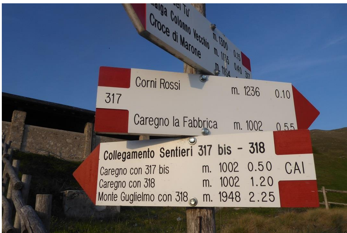
Inizio del sentiero a malga Lividino