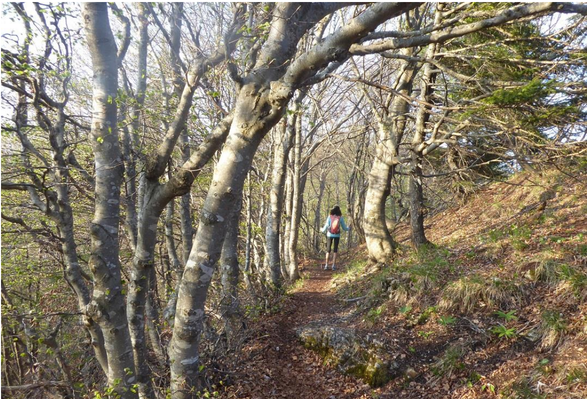
sentiero nel bosco