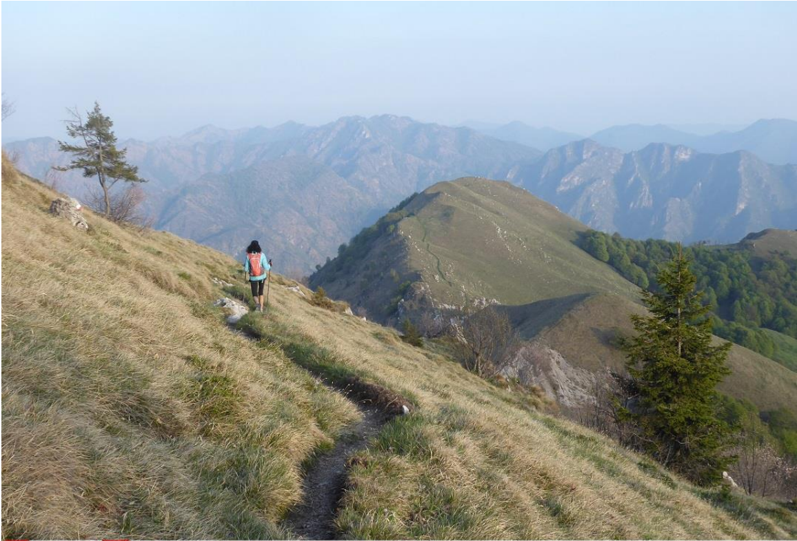
alla fine della cresta