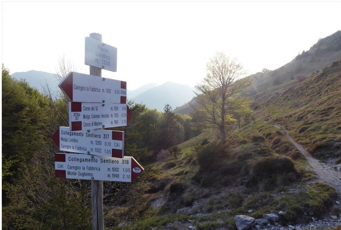
Passo Lividino incrocio con il sent. 317bis