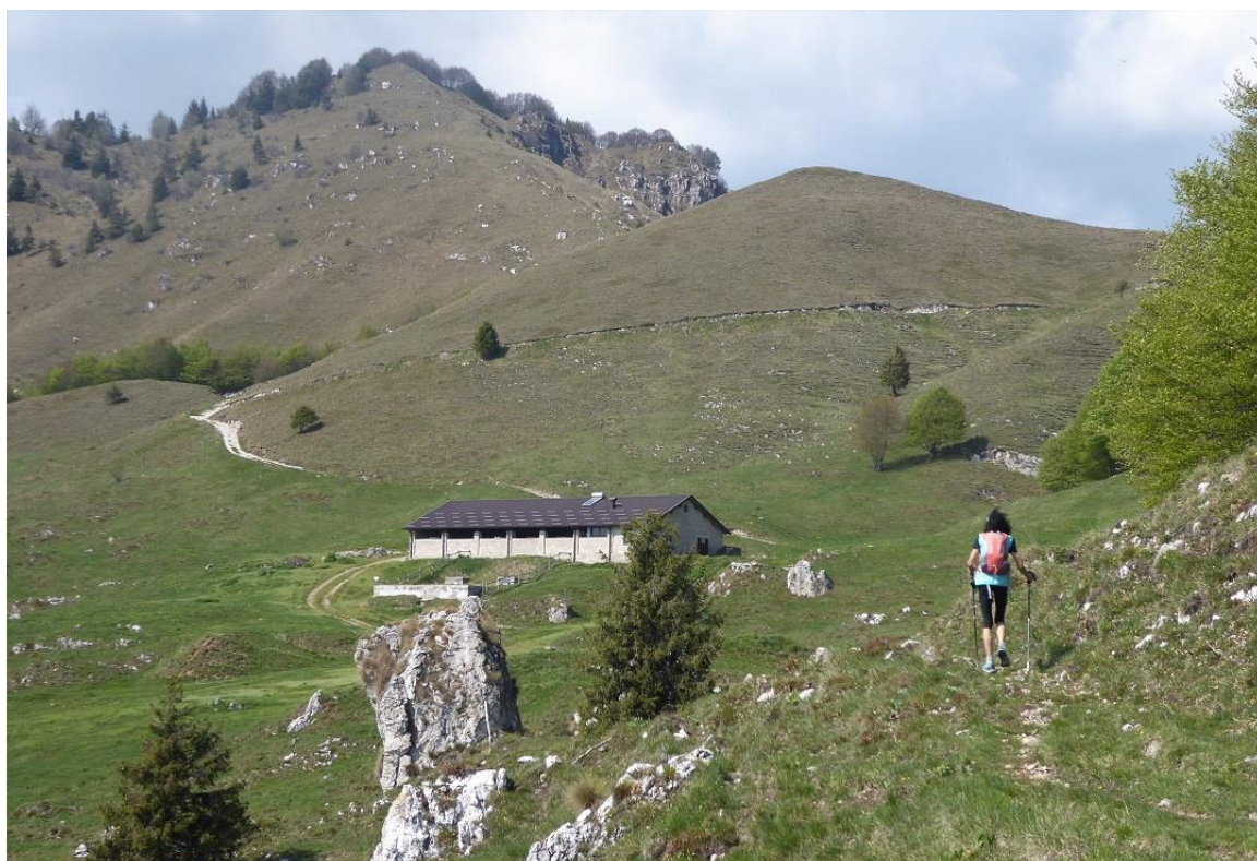
Malga Lividino si vede la stradina e dietro la cresta da salire