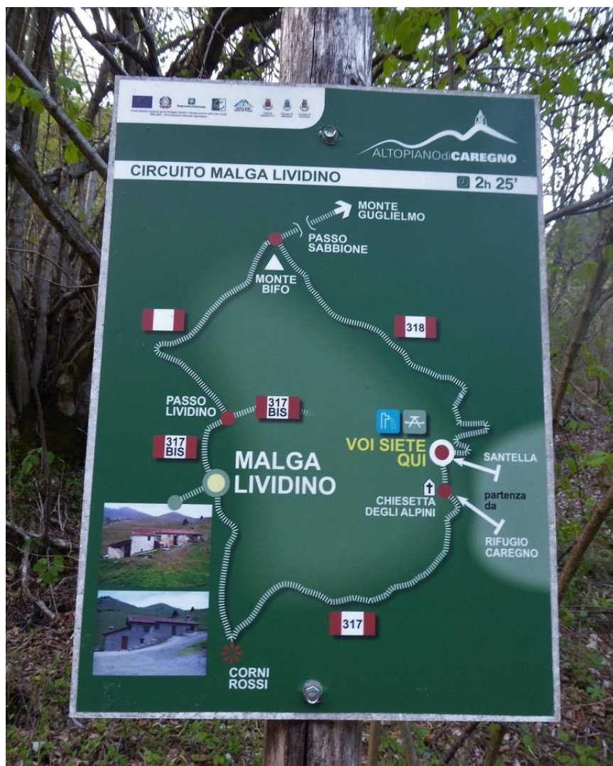
anello di malga Lividino