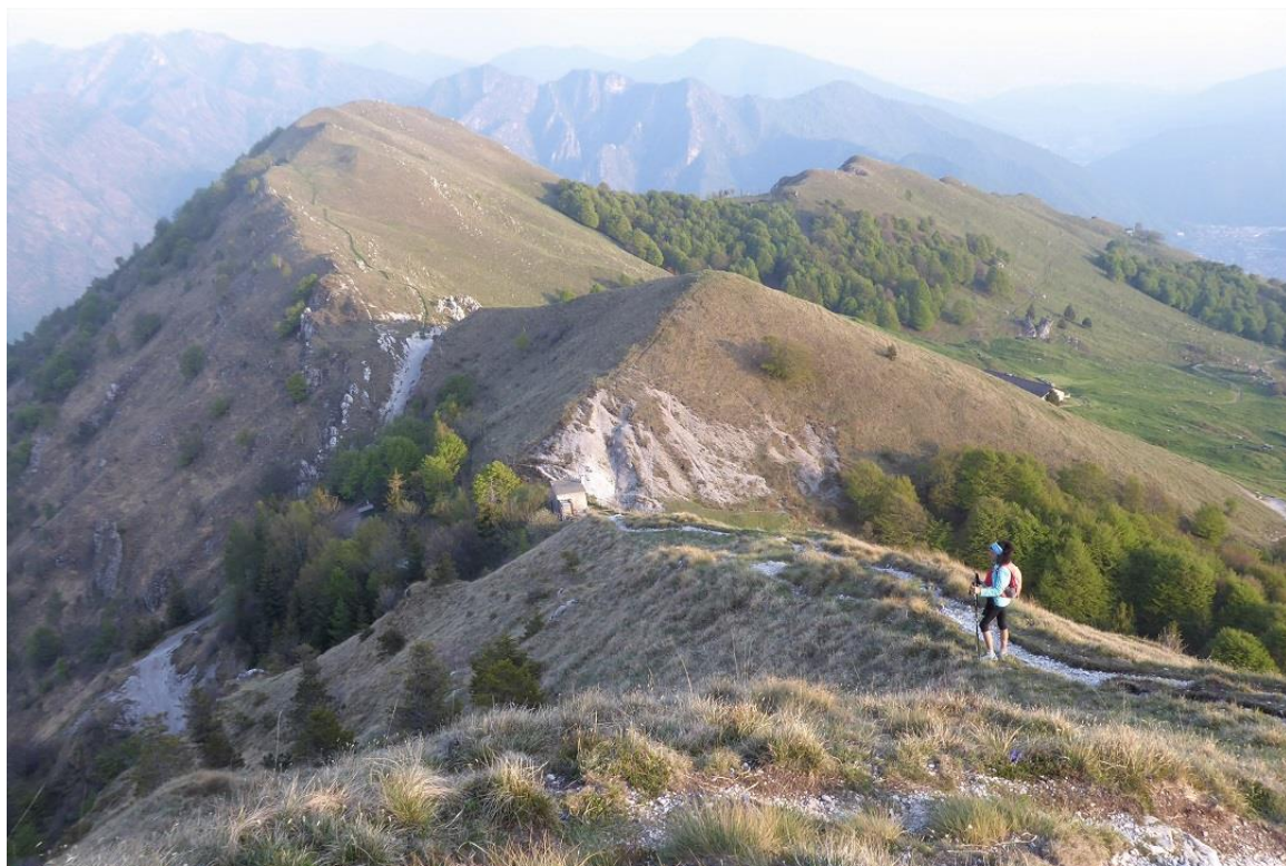
primo tratto in cresta in basso il passo Lividino