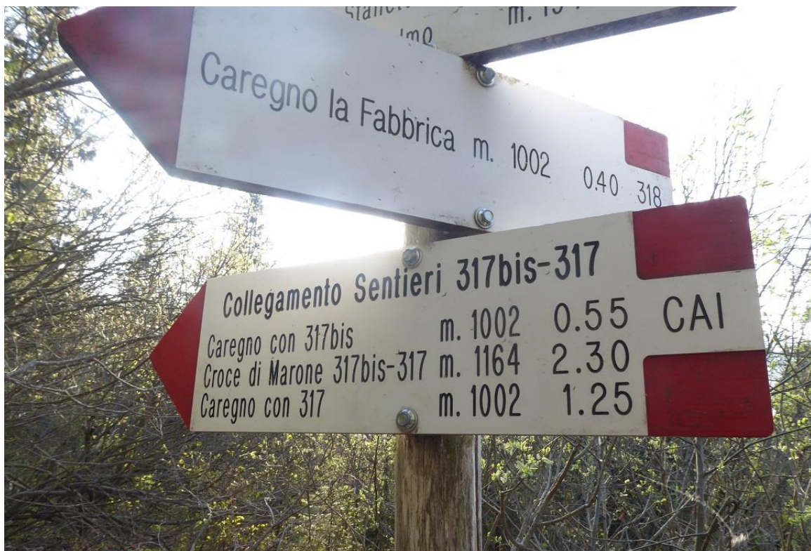
punto di incrocio con il CAI 318 nelle vicinanze del passo Sabbione