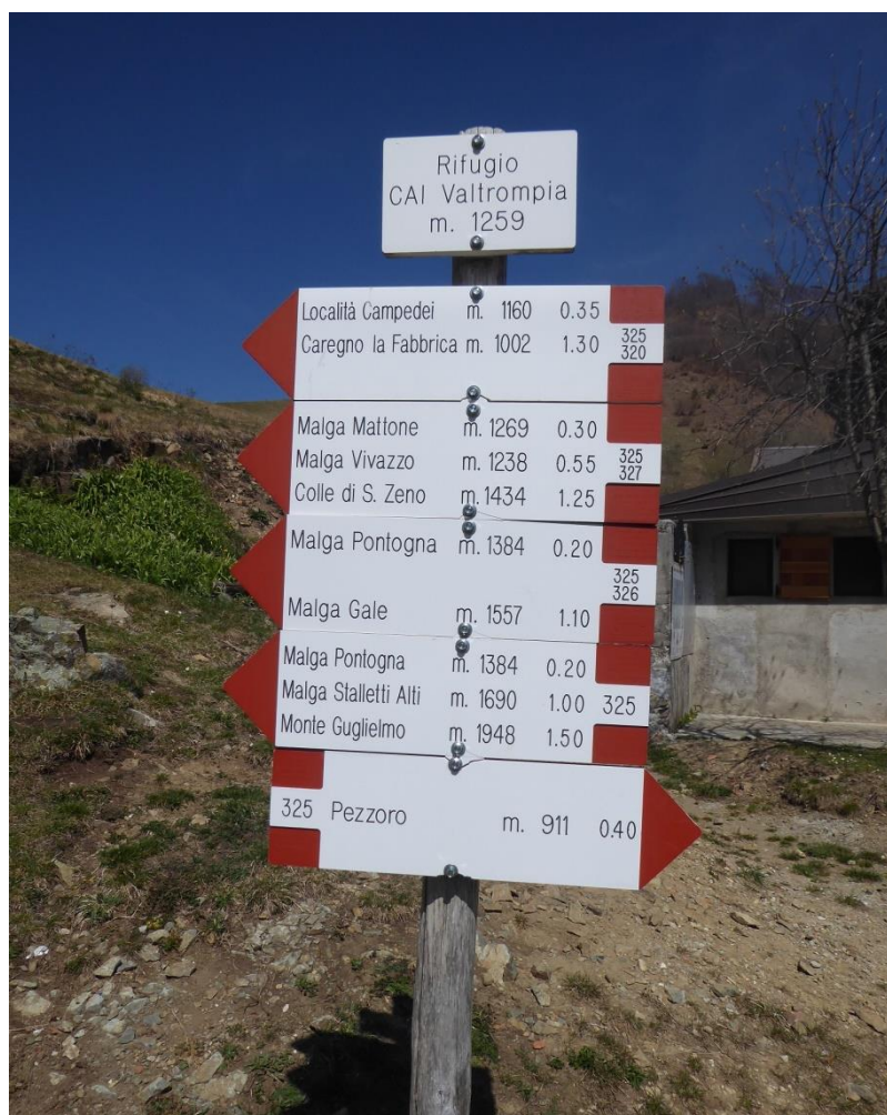
327 Rifugio CAI ValTrompia