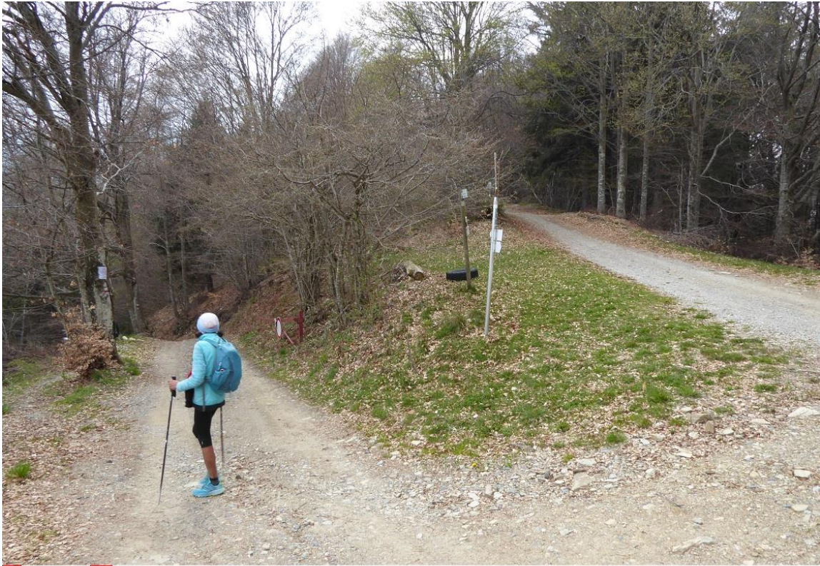
327 bivio sent.327 - 3V