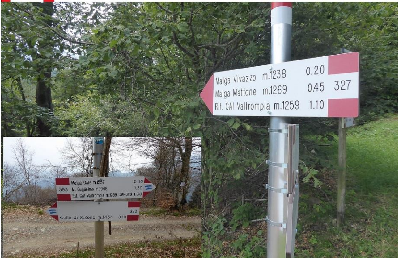
327 bivio sent.327 - 3V