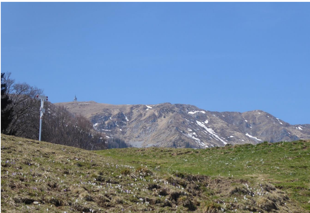
Pozza di Lavacolo